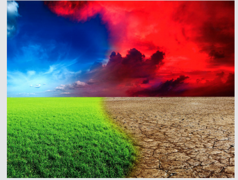
Erweiterung von 3 CMYK/RGB und PosterColor 2.0

Die neu entwickelte Farbstabilisierung und die verbesserte Farb-Engine bieten einen hohen Sättigungsgrad und eine breite Ausgabepalette bei den bestehenden Kalibrierungs- und Tinteneinstellungen, während die Bilddetails in den Schattenbereichen erhalten bleiben.