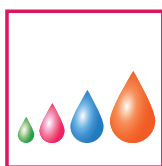
variable Tropfengröße Innen- & Außenanwendung