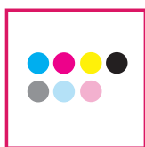
CMYK + Lc, Lm & Lk