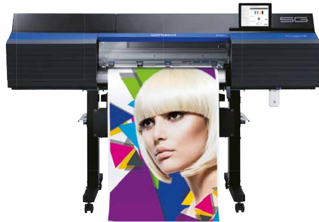
SG-300 (762 mm breit)