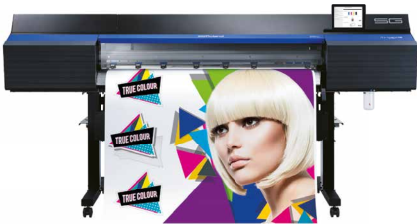
SG-540 (1.371 mm breit)