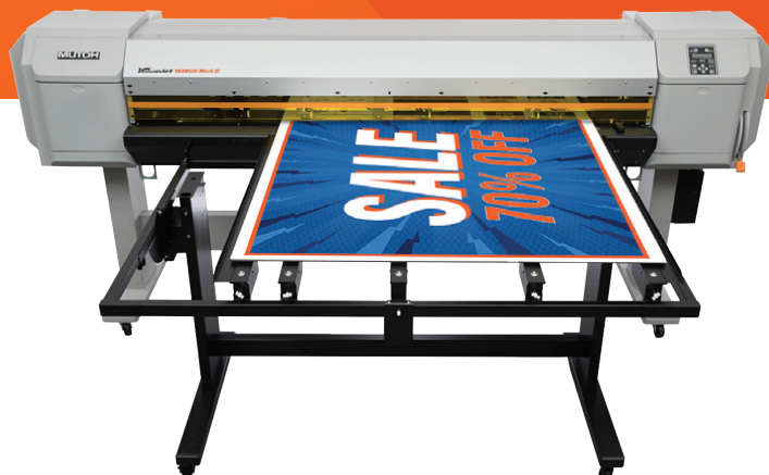
ValueJet 1638UH Mark II