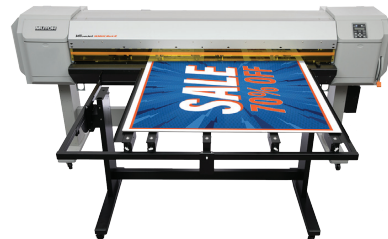
ValueJet 1638UR Mark II