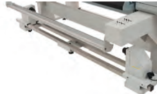
> motorisierte Aufwickelsysteme für Rollen bis 80 kg