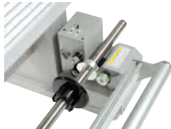
> Aufwickelsysteme für Rollen bis 30 kg