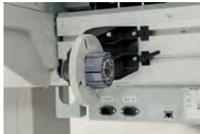
> verstellbarer Stützen für die Rollenhalterung

Abhängig von Ihren Anforderungen an Auflage und Anwendung stehen Ihnen verschiedene optional erhältliche Aufwicklungen für Rollen bis 30 kg Gewicht zur Verfügung. Außerdem bieten wir Ihnen voll motorisierte Abwickel-/Aufwickelsysteme für Rollen bis 80 bzw. 100 kg an.