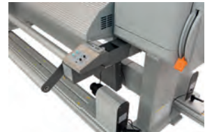
> motorisierte Aufwickelsysteme für Rollen bis 100 kg