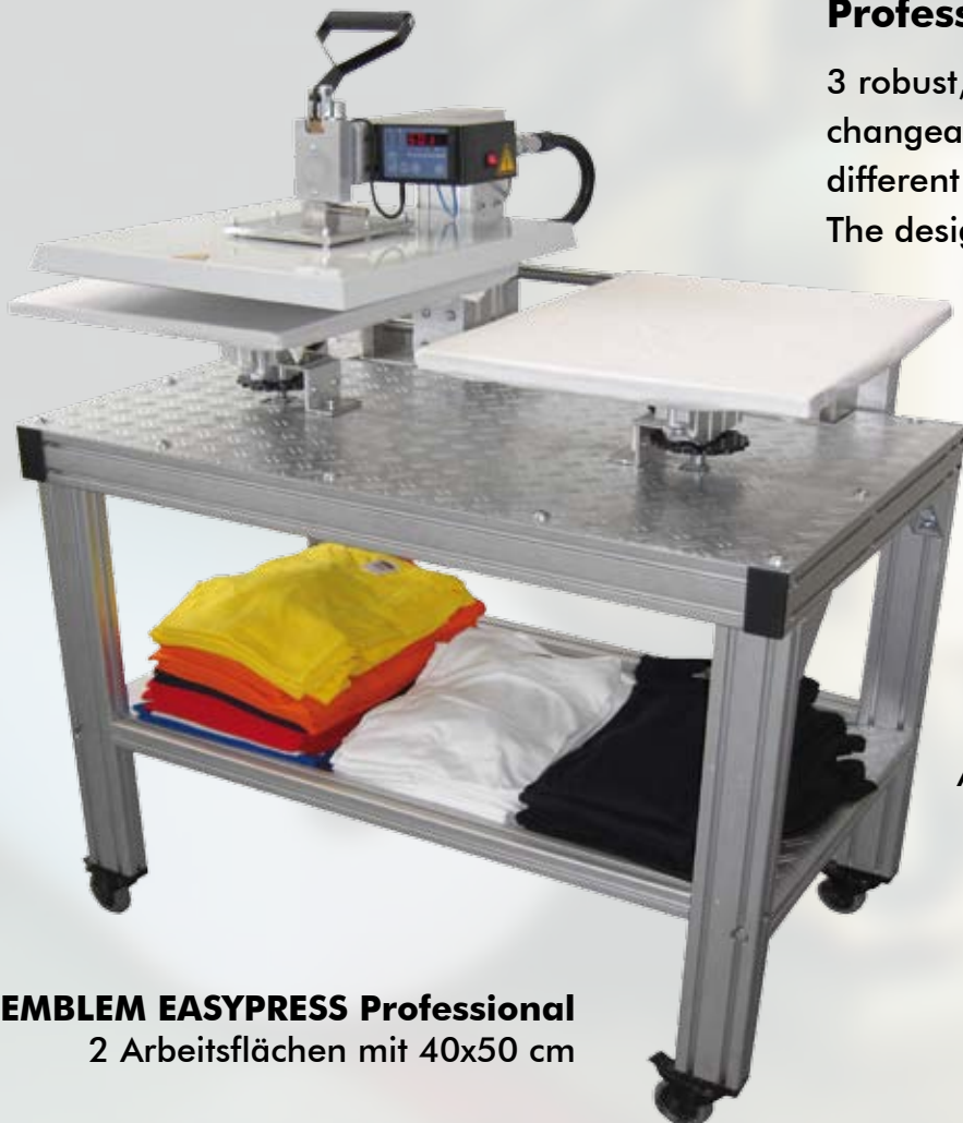
EMBLEM EASYPRESS Professional 2 Arbeitsflächen mit 40x50 cm